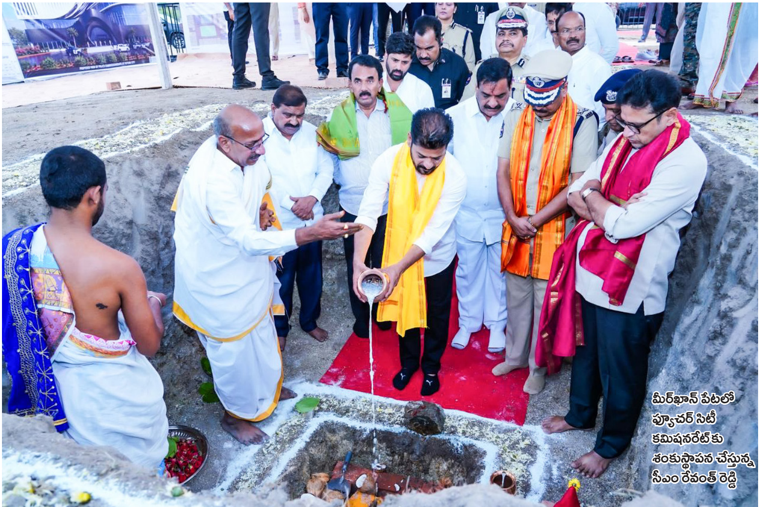
మీర్ఖాన్ పేటలో ప్యూచర్ సిటీ కమిషనరేట్ కు శంకుస్థాపన చేస్తున్న సీఎం రేవంత్ రెడ్డి

హైదరాబాద్, సికింద్రాబాద్, సైబరాబాద్ మాదిరిగానే.. నాలుగో నగరంగా భారత్ ప్యూచర్ సిటీని తీర్చిదిద్దాలనుకుంటున్నాం.... అని సీఎం రేవంత్ రెడ్డి చెప్పారు. మంగళవారం ఆయన మహేశ్వరం నియోజకవర్గంలోని మీర్ఖాన్ పేటలో ప్యూచర్ సిటీ కమిషనరేట్ కు శంకుస్థాపన చేశారు.