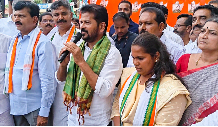
మధ్య ఉన్న అవగాహనతోనే కేసులు, అరెస్టులు లేవు అని రేవంత్ పేర్కొన్నారు.

విజయన్ పై శబరిమల బంగారం చోరీ, బంగారం స్వగ్లింగ్ కేసులున్నాయి. ఆయన గాడ్ ఫాదర్ సరేంద్ర మోదీ ఢిల్లీలో ఉన్నారు. మోదీనే ఈ కేసులన్నీ సుంచి విజయన్ ను రక్షిస్తున్నారు. దేశం కోసం తమ జీవితాలను, ఆస్తులను త్యాగం చేసిన గాంధీ కుటుంబాన్ని మాత్రం రక్షకకాల కేసులతో వేధిస్తున్నారు. కేజ్రీవాల సహా అనేక మంది నేతలను ఈ కేసులతో వేధించారు. అరెస్టులు చేశారు. కానీ విజయన్ జోలికి ఎందుకు రావడం లేదో ఒక్కసారి ఆలోచించాలి. మోదీ, విజయన్